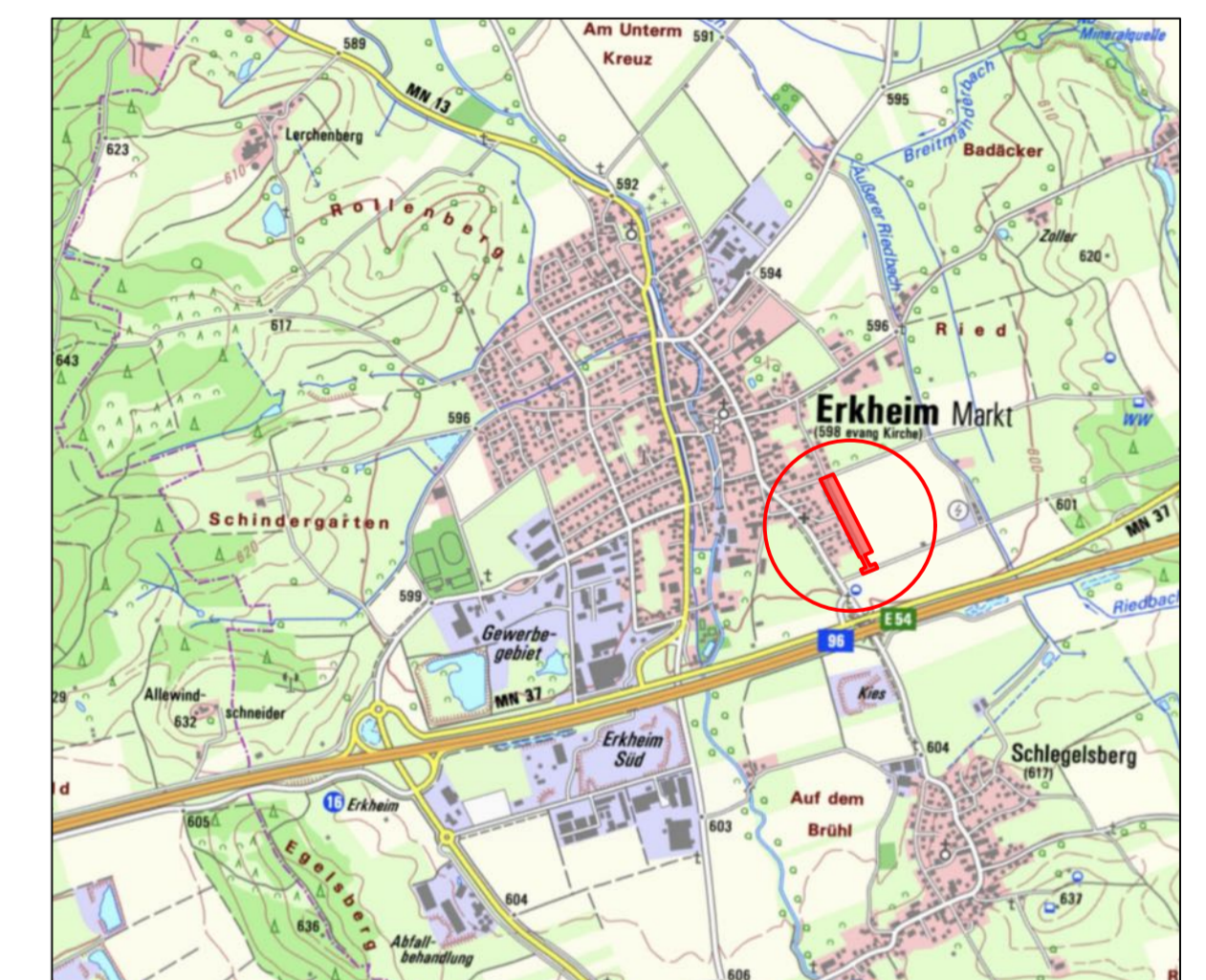
Übersichtslageplan ohne Maßstab

Planvorhaben: 13. Änderung des Flächennutzungsplans ENTWURFSFASSUNG vom 24.09.2024